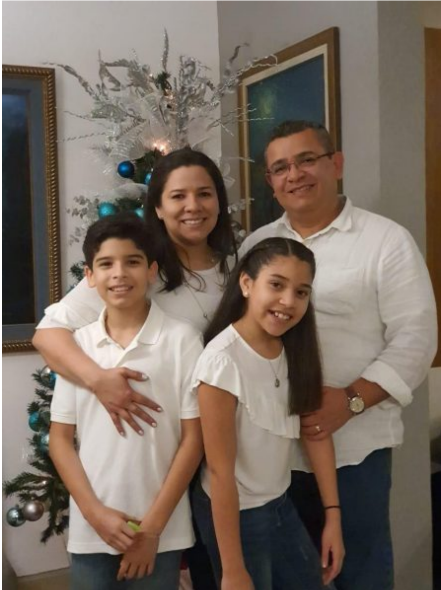
Una de las familias que ha recibido la Capillita Peregrina de Fátima en El Salvador

Orar ha sido el mensaje más importante de nuestra madre María.