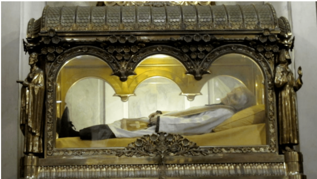
Cuerpo incorrupto del Santo Cura de Ars

En la noche del 3 de agosto llegó su obispo. El santo lo reconoció, pero no pudo decir palabra alguna. Hacia la medianoche el fin era inminente. A las 2:00 a.m. del 4 de agosto de 1859, el Obispo leyó: « Que los santos Ángeles de Dios vengan a su encuentro y lo conduzcan a la Jerusalén celestial », el Cura de Ars encomendó su alma al Señor al que había dedicado toda su vida. Como los santos, este artículo explica quienes son los santos .